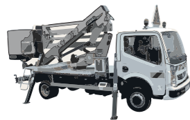
PEMP dont la translation n'est admise qu'avec la plate-forme de travail en position de transport avec élévation multidirectionnelle.